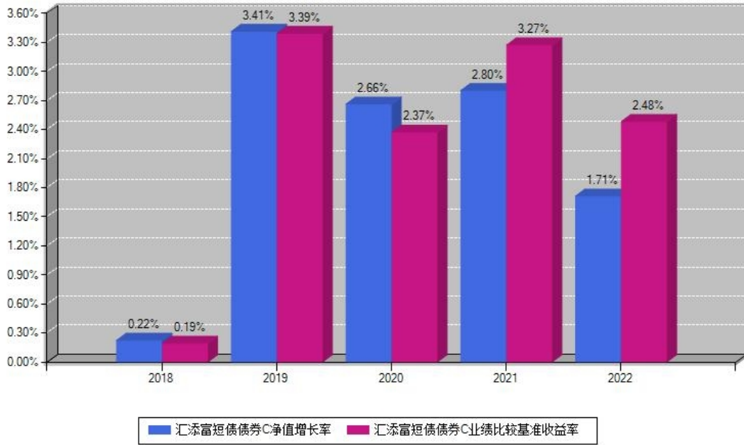
汇添富短债债券C每年净值增长率与同期业绩基准收益率对比图

注：数据截止日期为2022年12月31日，基金的过往业绩不代表未来表现。本《基金合同》生效之日为2018年12月13日，合同生效当年按实际存续期计算，不按整个自然年度进行折算。