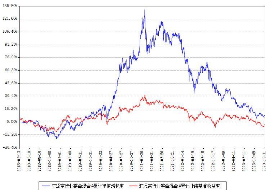
汇添富行业整合混合A累计净值增长率与同期业绩基准收益率对比图