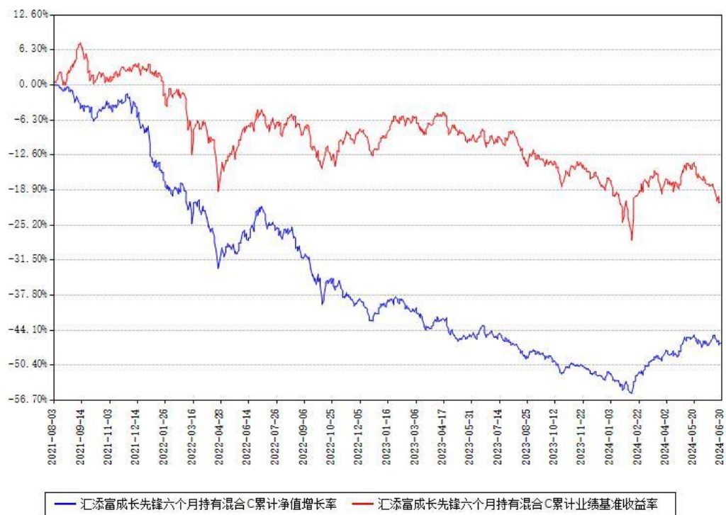
汇添富成长先锋六个月持有混合C累计净值增长率与同期业绩基准收益率对比图