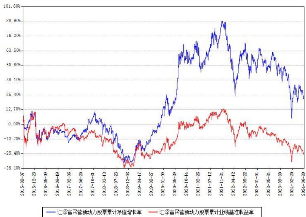
汇添富民营新动力股票累计净值增长率与同期业绩基准收益率对比图