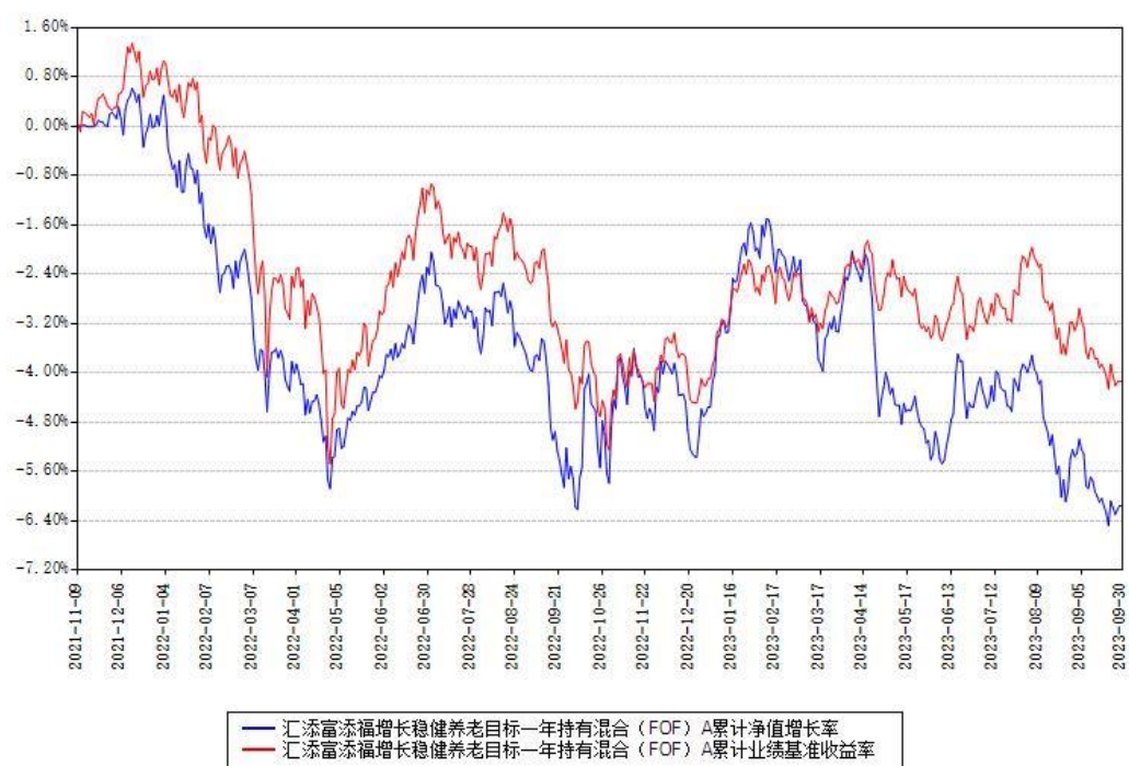
汇添富添福增长稳健养老目标一年持有混合（FOF）A累计净值增长率与同期业绩基准收益率对比图

(二)自基金合同生效以来基金累计净值增长率变动及其与同期业绩比较基准收益率变动的比较图