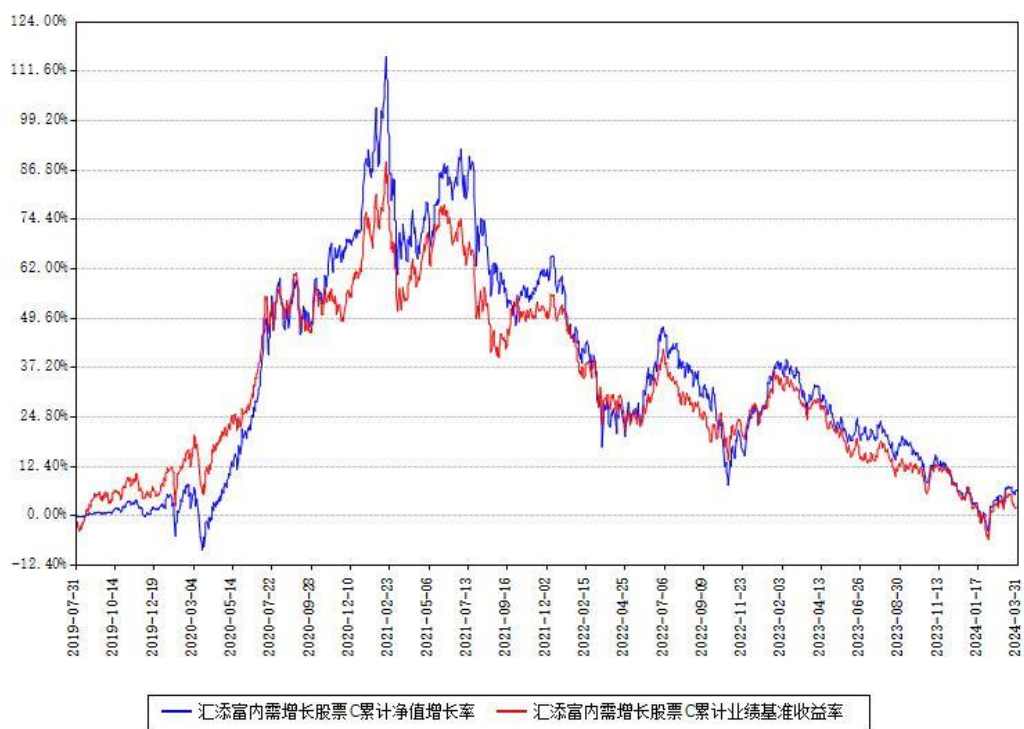
汇添富内需增长股票C累计净值增长率与同期业绩基准收益率对比图