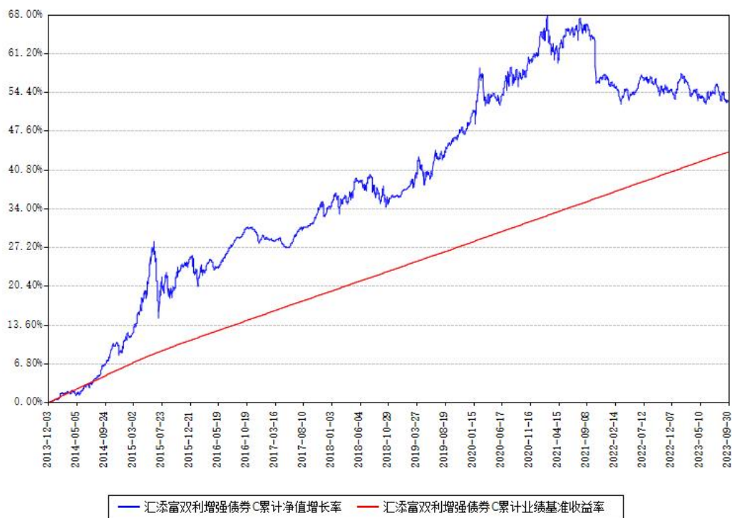
汇添富双利增强债券C累计净值增长率与同期业绩基准收益率对比图