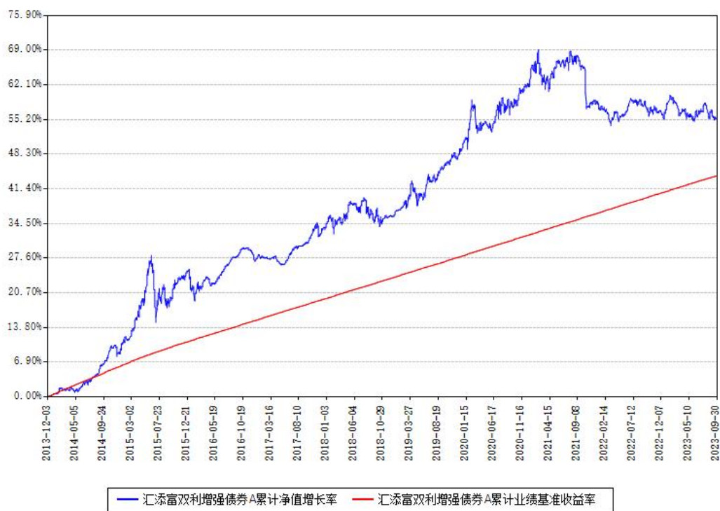
汇添富双利增强债券A累计净值增长率与同期业绩基准收益率对比图