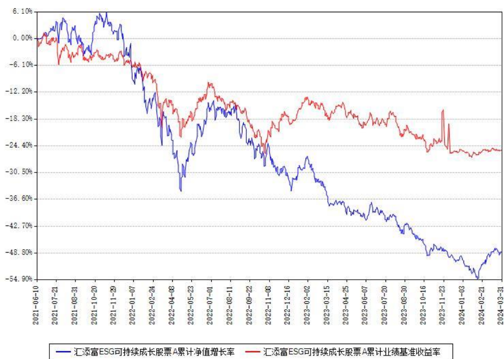
汇添富 ESG 可持续成长股票 A 累计净值增长率与同期业绩比较基准收益率对比图