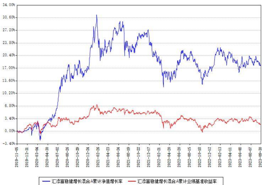
汇添富稳健增长混合A累计净值增长率与同期业绩基准收益率对比图