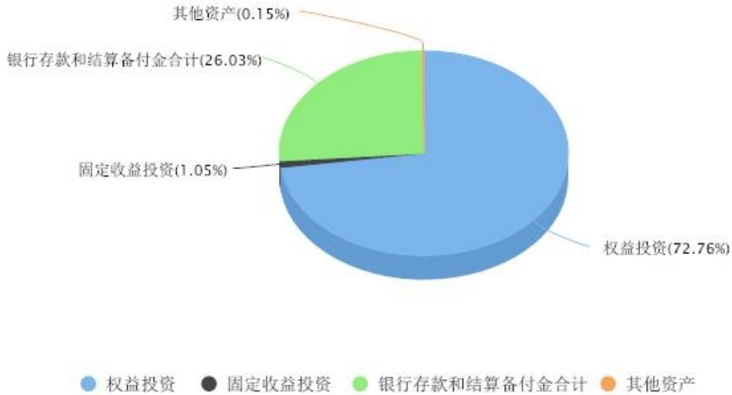
投资组合资产配置图表 数据截止日期:2024年06月30日