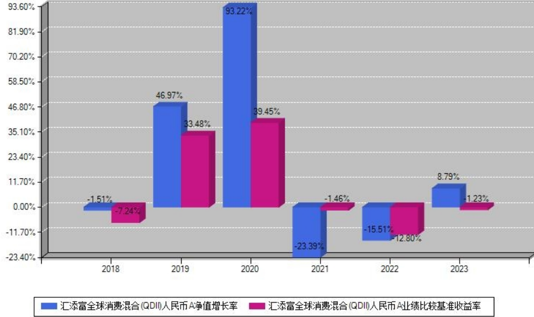
汇添富全球消费混合(QDII)人民币A每年净值增长率与同期业绩基准收益率对比图

注：数据截止日期为2023年12月31日，基金的过往业绩不代表未来表现。本《基金合同》生效之日为2018年09月21日，合同生效当年按实际存续期计算，不按整个自然年度进行折算。