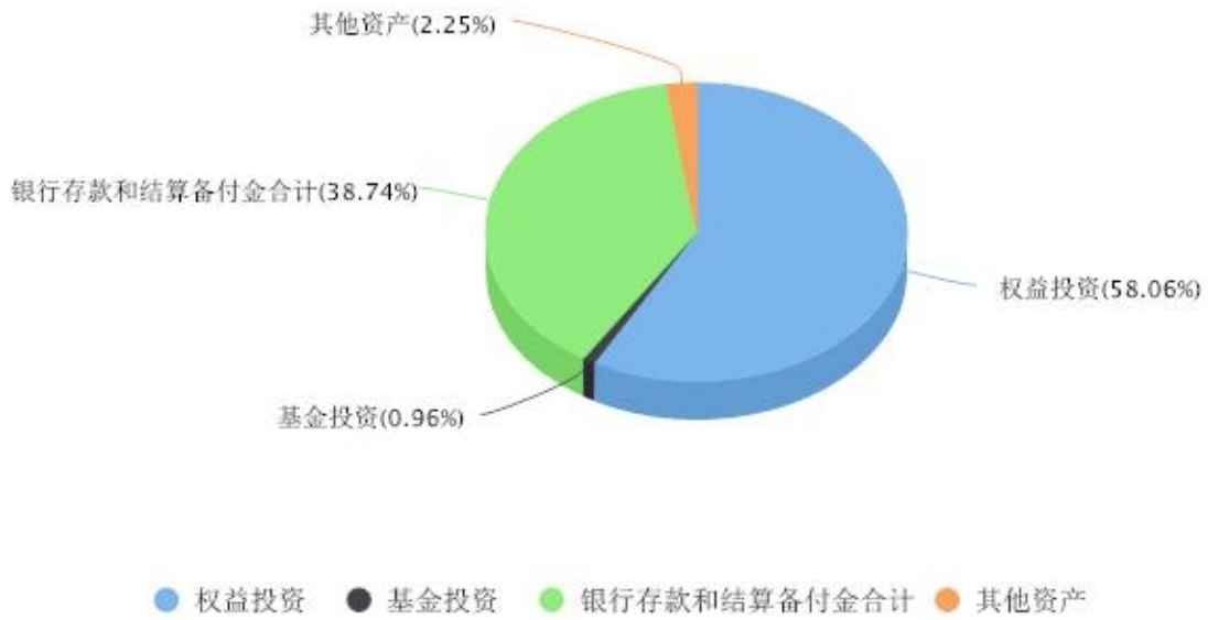
区域配置图表 数据截止日期:2024年06月30日