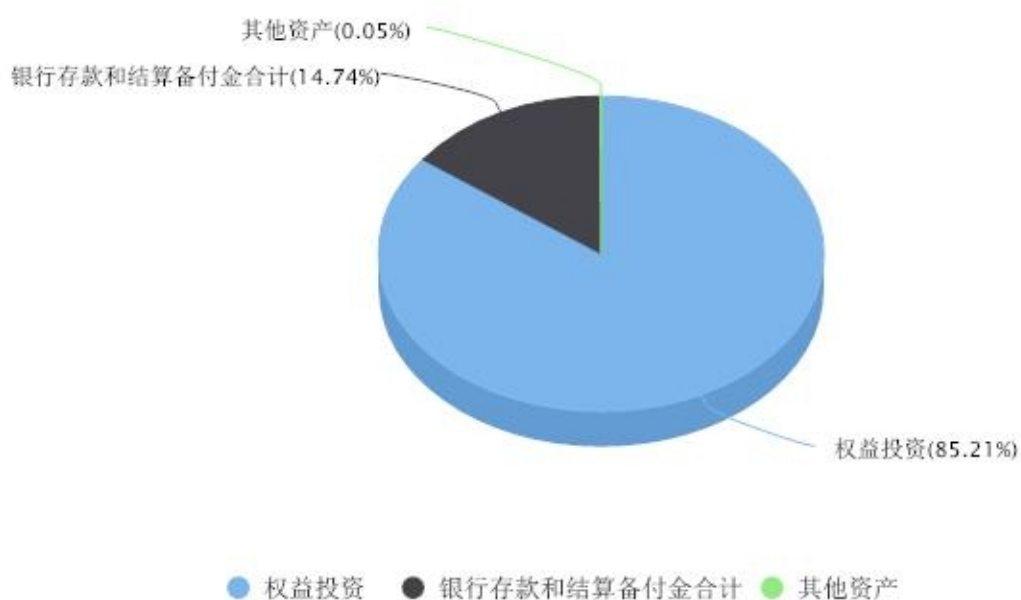
投资组合资产配置图表 数据截止日期:2023年09月30日